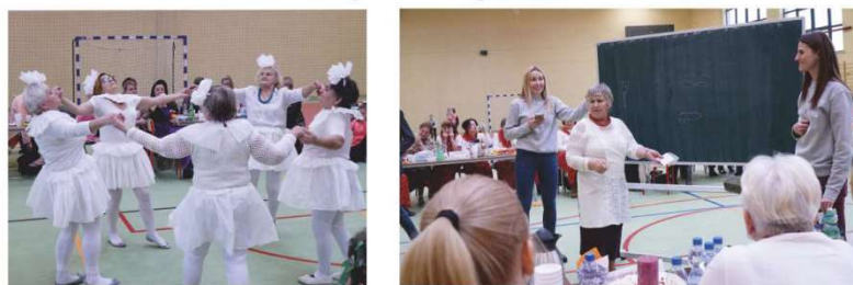
Koło Gospodyń Wiejskich z Godzikowic