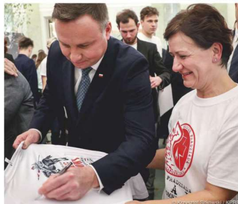
fol. Kancelaria Prezydenta RP