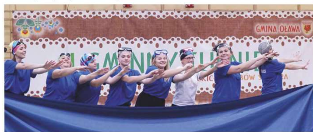
Pływanie synchroniczne Rady Sołeczkiej Godzikowic