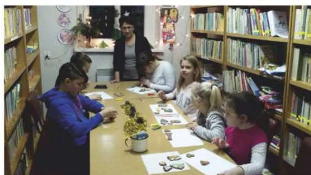
W Owczarach dzieci przed świętami kleiły szopki i zdożyły pierniki