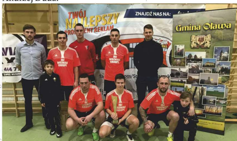
Zwycięzcy tegorocznej Ligi Halowej Gminy Oława i Pucharu Ligi - Lemarko Gać