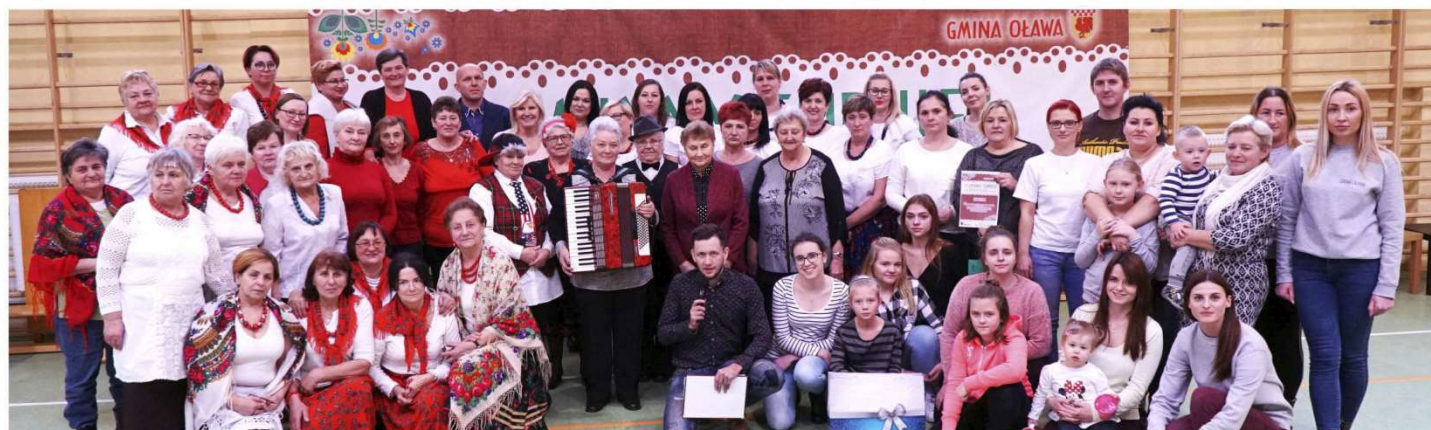
Uczestnicy II edycji Turnieju Kół Gospodyń Wiejskich, Rad Sołeckich i Klubów Seniora