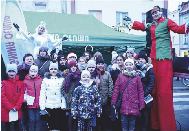
Słoneczniki tuż przed występem