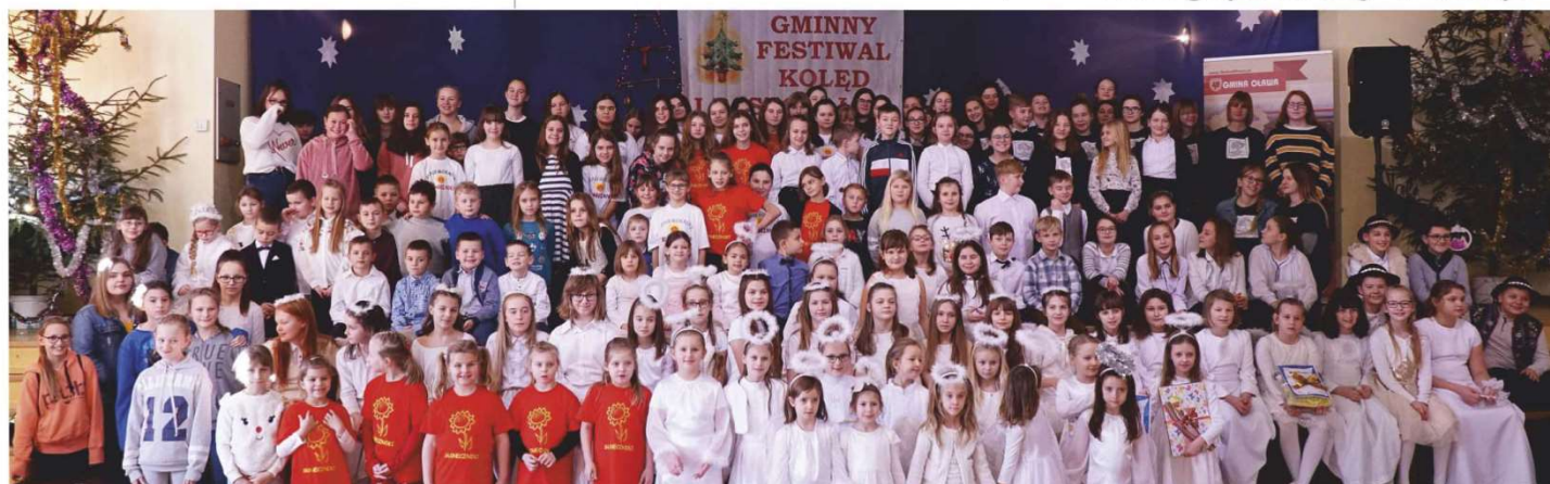
Uczestnicy festiwalu na zakończenie wspólnie zaśpiewali kolędę