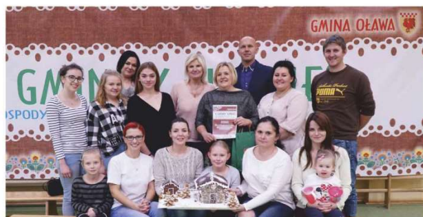
Zwycięzcy Turnieju - Rada Sołeczka z Godzikowic