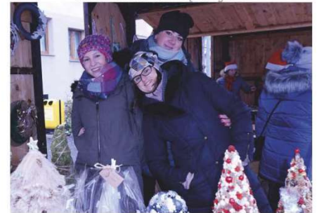
Przedstawicielki Rady Sołeckiej z Niwnika