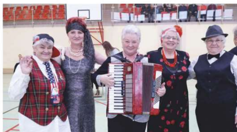
Panie z Klubu Seniora „Kalina”