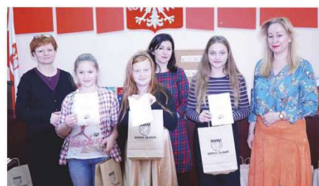
To oni najlepiej recytowali po niemiecku