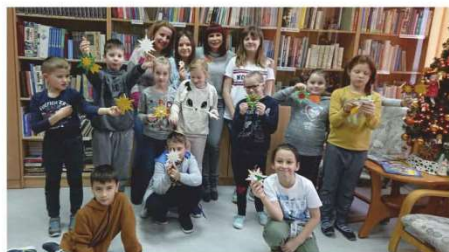
W Marcinkowicach obchodzono Świątowy Dzień Pluszowego Misia, a przed świętami dzieci tworzyły ozdoby choinkowe i pomagały w ubieraniu drzewka.