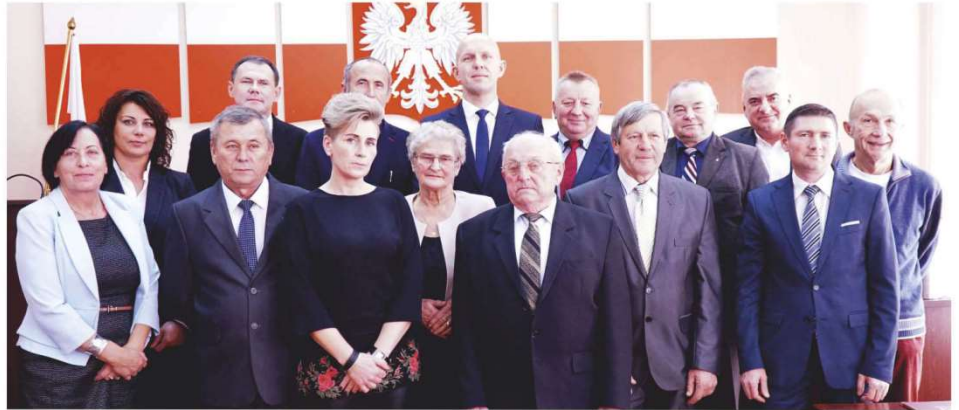
Na zakończenie sesji zrobiono pamiątkowe zdjęcia rady...