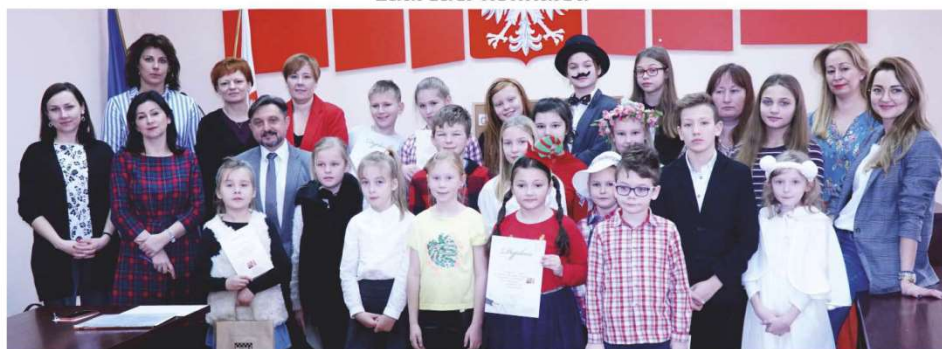
Pamiątkowe zdjęcie wszystkich uczestników konkursu i komisji