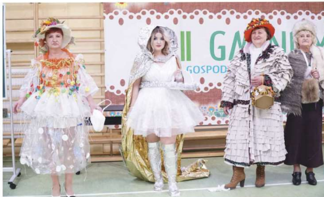
Pokaz mody „Zima 2018” wzbudził wiele emocji