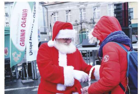
Podczas Jarmarku Święty Mikołaj Rozdawał słodczyce