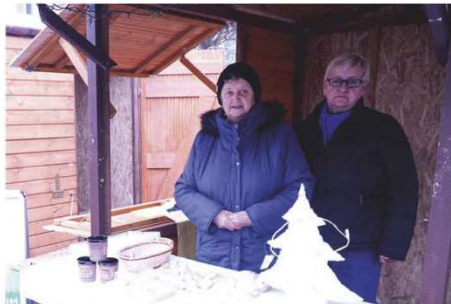
Seniorki z „Kaliny” serwowały grzańca i pyszny „Bigos sołtysa”