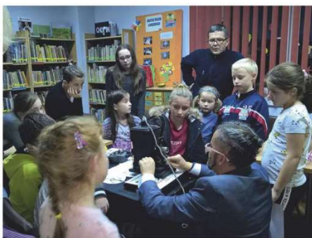
Podczas zajęć Kino Szkoła dzieci dowiedziały się m.in. jak powstaje film metodą poklatkową