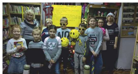
Ostatnie zajęcia w ramach projektu