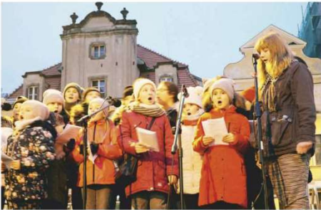
Zespół Wokalny „Słoneczniki”