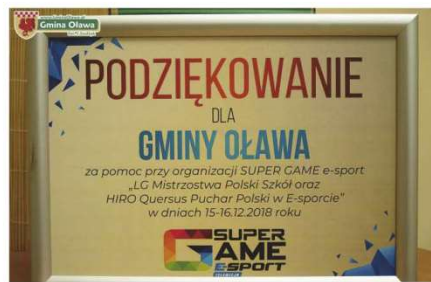
fol. UG Olawa JS