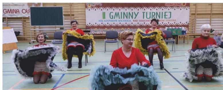
Kankan 50+ w wykonaniu pań z KGW Ścinawa