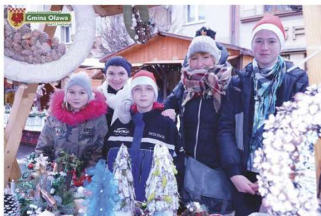
Szkoła Podstawowa w Drzemlikowicach