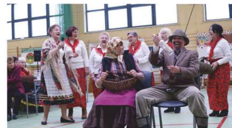
i KS „Magnolia”