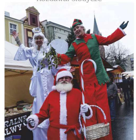
Mikołajowi towarzyszyli aniołek i elfik