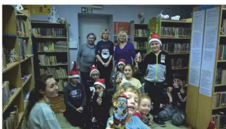
Biblioteka Publiczna w Godzikowicach i Koło Gospodyń Wiejskich organizowały „Mikołajki”.