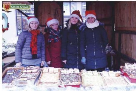
KGW Jankowice Małe