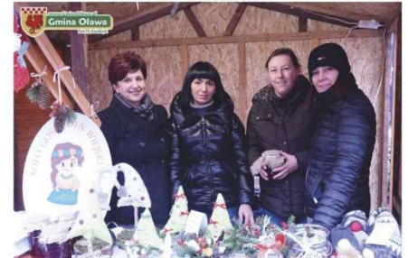
Panie z KGW GAĆaneczki