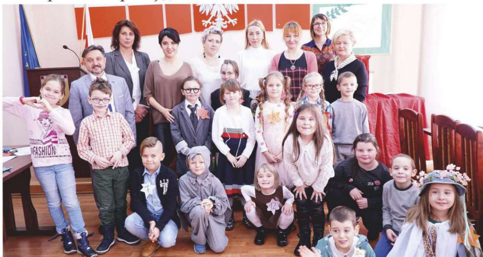
Uczestnicy Gminnego Konkursu Recytatorskiego