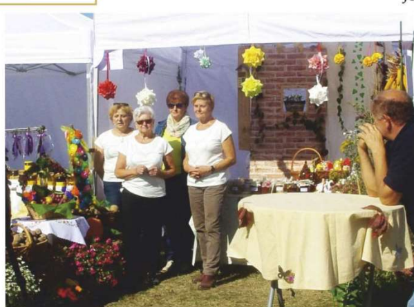
Na Targach Chłopskich stoisko Jankowa zajęło II m. w kategorii - wystroj stoiska