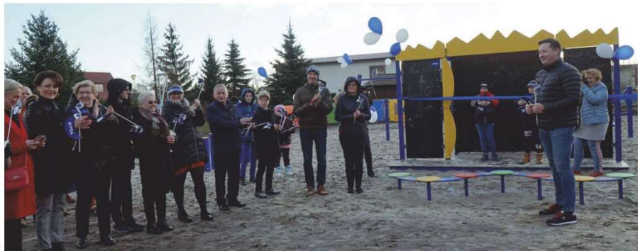
fol. UG Olawa JS