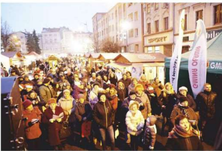
Wspólnie kolędowaliśmy także z Klubem Seniora „Kalina”