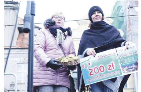
Nasze Panie z KGW Gac. Gratulujemy!