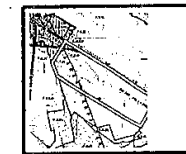
STANOWISKO OBRZĘDUNKOWE I PLAN ZAGOSPODAROWANIA PRZESTRZENNEGO GMINY OŁAWA